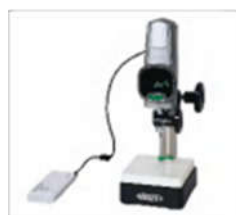
Питание от зарядного устройства