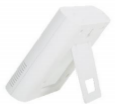
Подставка (включена в комплект)

Регистратор данных температуры и влажности в диапазоне от -30 до 70^{\circ}\text{C} , оснащен монохромным дисплеем с подсветкой, представляет собой компактное электронное устройство, используемое для мониторинга и записи уровней температуры и влажности в различных средах за определенный период. Эти регистраторы данных являются ценными инструментами в таких отраслях, как сельское хозяйство, фармацевтика, хранение продуктов питания, отопление, вентиляция и кондиционирование воздуха и исследования, где точные условия окружающей среды имеют важное значение.